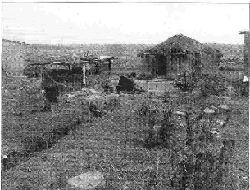
Eine typische Zulu-Hütte, wie sie in der Gegend von Nkandla überall in den Bergen zu sehen ist.